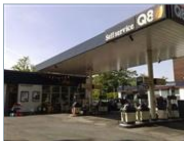
MILANO (MI) Viale Liguria 42